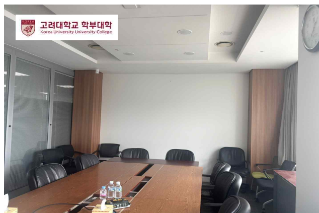
<그림 2> 로고 첨부 예시

※ 로고 다운로드: LMS( https://lms.korea.ac.kr/ ) → 2026학년도 창의연구 프로젝트 (CRP) 또는 창의연구 심화프로젝트 교과목(ACRP) 이수 → [과제] 최종보고서